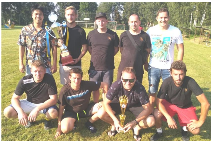
Vítězné mužstvo Černý Balet